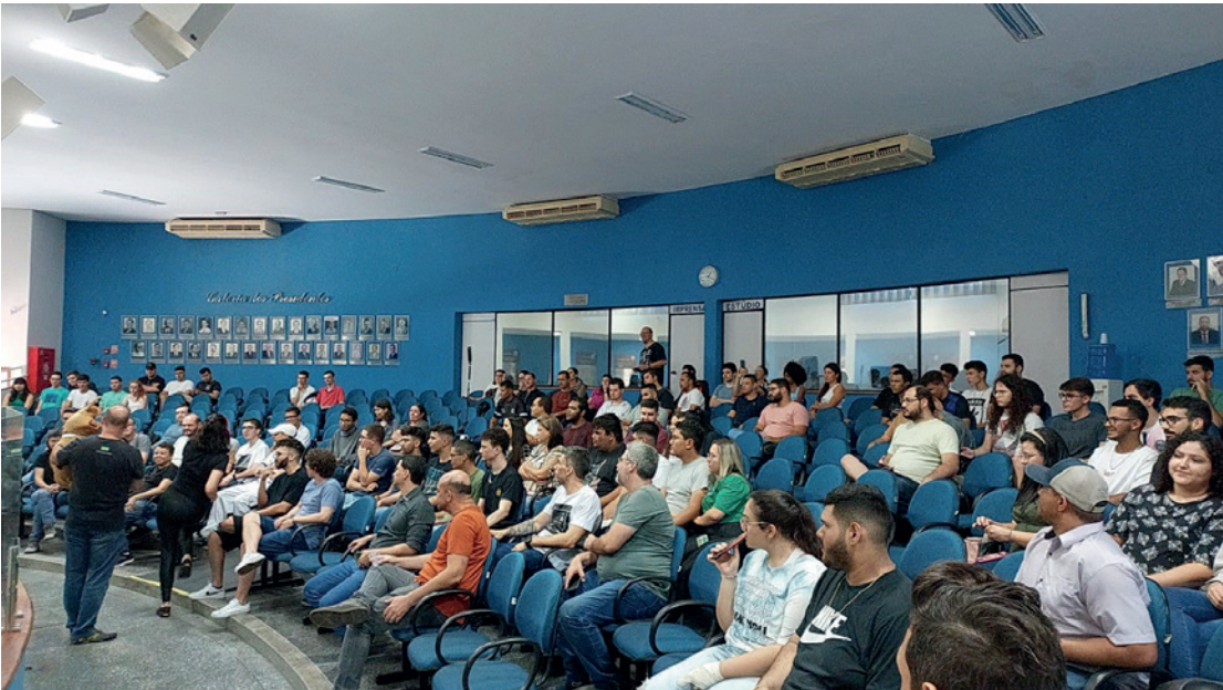
Em Jales, o evento ocorreu na Câmara Municipal

A Fatec Professor José Camargo - Fatec Jales não poderia ficar de fora de um grande evento da área de Tecnologia da Informação (TI), do qual foi, inclusive, instituição parceira. Trata-se do Campus Party na