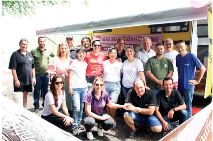
Integrantes do Rotary Club de Jales e Casa da Amizade durante o evento Rota do Chopp em prol ao Fundo Social de Solidariedade

O Rotary Club de Jales, a Casa da Amizade e a banda Born realizaram um grande evento em prol do Fundo Social de Solidariedade de Jales (FSS), a Rota do Chopp, no sábado, dia 8 de outubro, no Regional Plaza Hotel, na Marginal Áureo Fernandes de Faria. O evento reuniu os amantes do rock and roll que se divertiram ao som da Banda Born, responsável pelo repertório recheado de grandes clássicos de sucesso. O