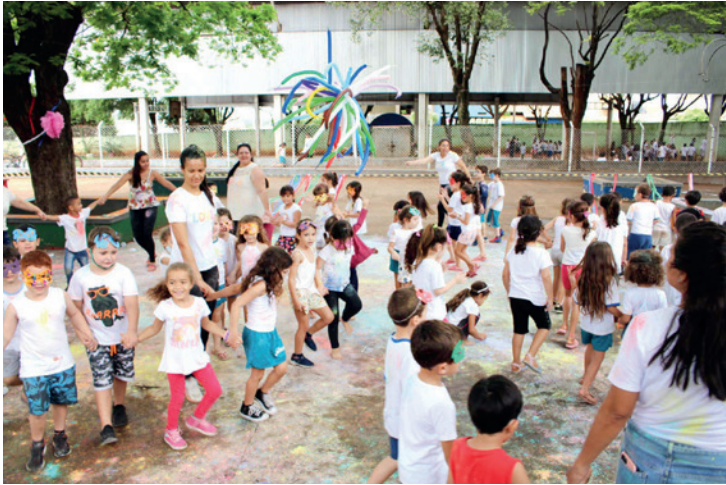
Os alunos se divertiram com o pó colorido que eles próprios produziram em comemoração a chegada da Primavera e Dia das Crianças