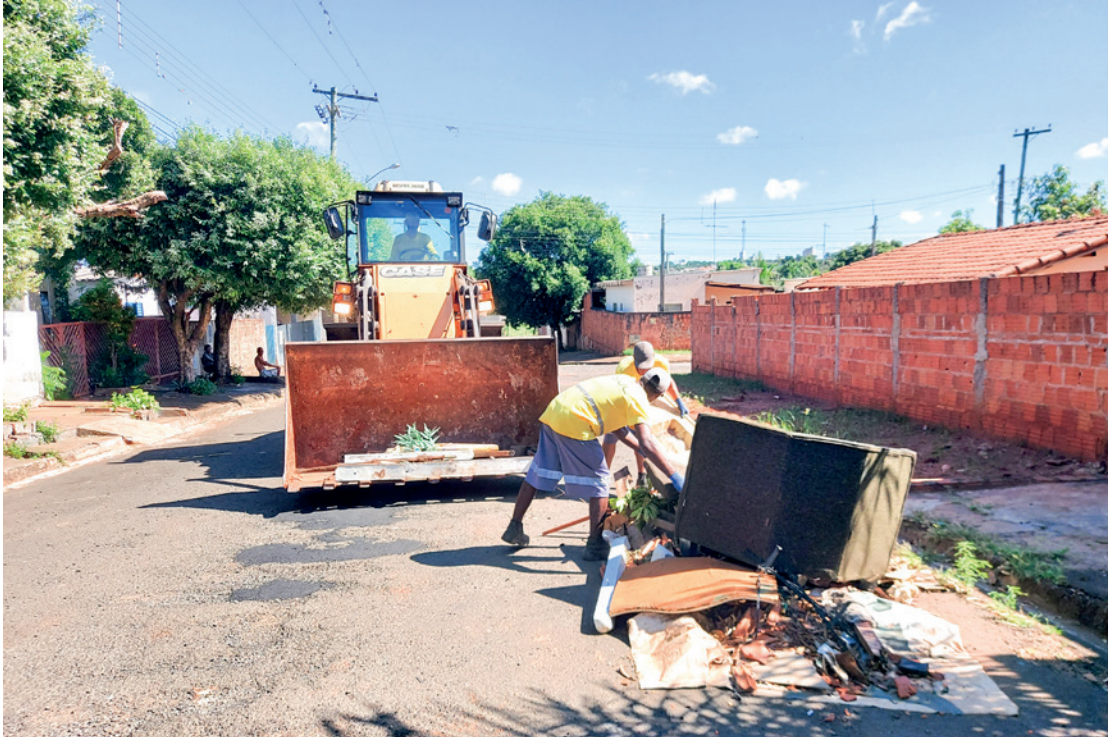
A partir do dia 24 de outubro, começa a 2ª edição do Projeto Jales Mais Limpa, que consiste em recolher resíduos volumosos retirados pela população dos quintais e interior de suas residências

Com o propósito de deixar a cidade mais limpa, bem cuidada e contribuir para eliminar criadouros do mosquito Aedes aegypti, transmissor de doenças como a dengue, zika e chikungunya, a Prefeitura de Jales, por meio de uma força tarefa das secretarias municipais de Agricultura, Pecuária, Abastecimento e Meio Ambiente, de Desenvolvimento Urbano, Infraestrutura e Mobilidade Urbana, de Saúde e de Comunicação Social, vai realizar mais uma edição do Jales Mais Limpa, um mutirão de limpeza por toda a cidade, a partir do dia 24 de outubro.