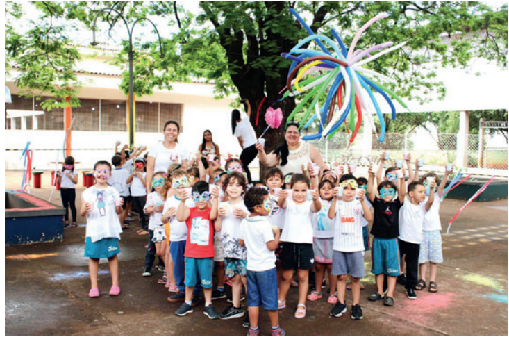
Os alunos se divertiram com o pó colorido que eles próprios produziram em comemoração a chegada da Primavera e Dia das Crianças