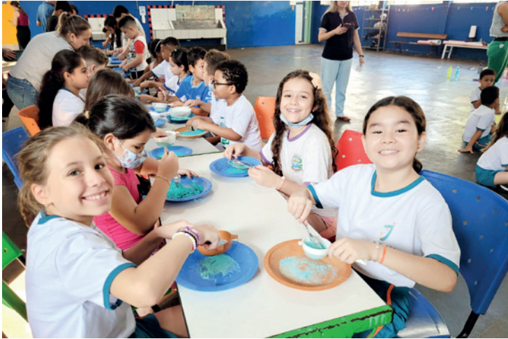
Os alunos se divertiram com o pó colorido que eles próprios produziram em comemoração a chegada da Primavera e Dia das Crianças

Pensando em proporcionar aos alunos uma semana da criança diferente, de modo que eles pudessem vivenciar novas experiências, os gestores da E. M. Profª Elza Pirro Viana ofereceram às crianças uma semana voltada para o brincar, com o objetivo de auxiliá-los na formação, socialização, desenvolvimento de habilidades psicomotoras, sociais, físicas, afetivas, cognitivas e emocionais, pois ao brincar as crianças expõem sentimentos, aprendem, constroem, exploram, pensam, sentem e se movimentam. Para que tudo isso acontecesse da forma mais prazerosa e divertida possível, a equipe gestora decidiu estabelecer o dia 7 de outubro para a realização de atividades, oficina de