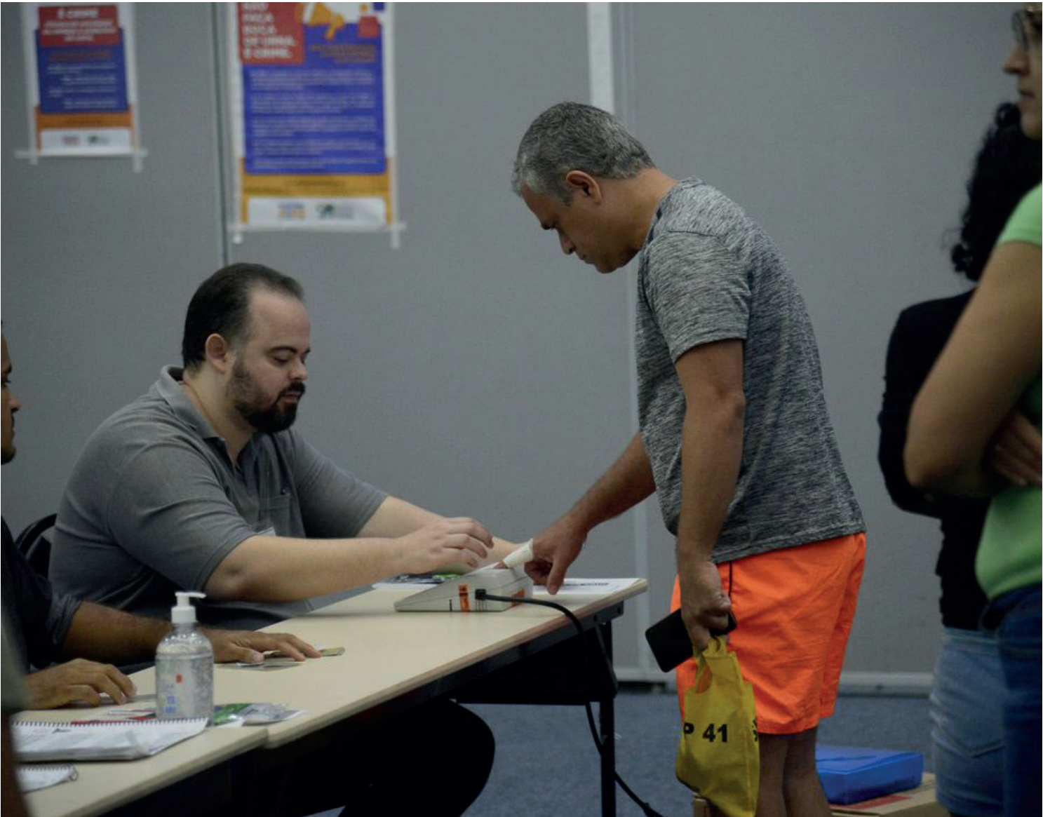
Gostei de ver a dinâmica das pessoas. Gostei da parte humana em querer votar, em querer demonstrar uma melhoria no nosso país. Foi tranquilo, não teve briga, não teve discussão, foi um cenário muito bom no primeiro