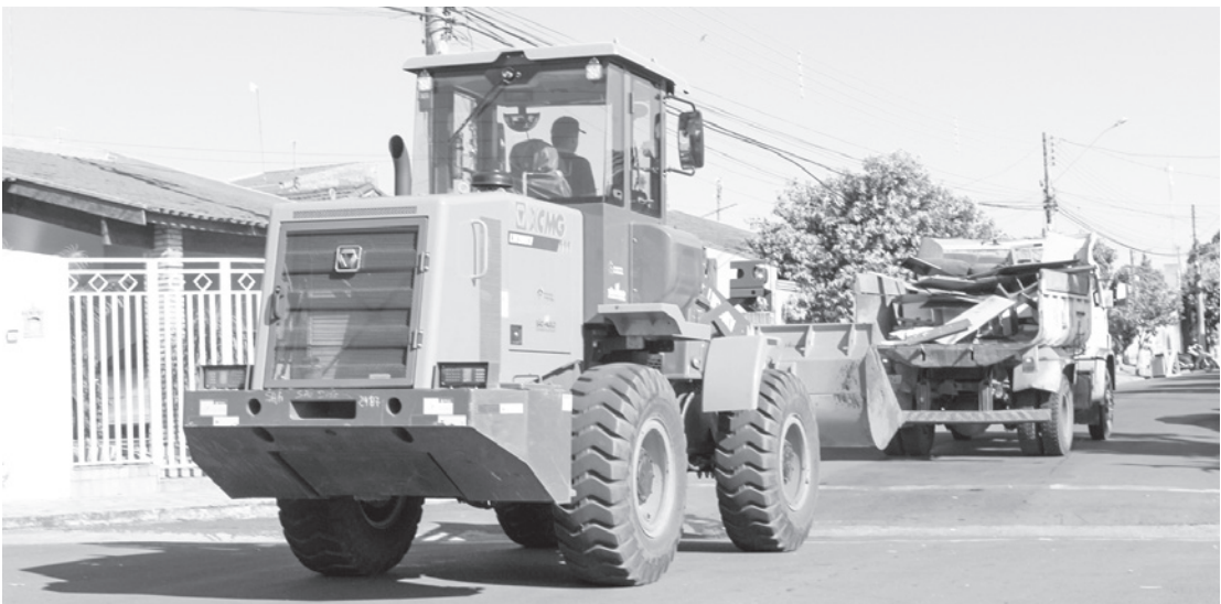
Todos os bairros da cidade foram contemplados com a 2ª edição do projeto Jales Mais Limpa

e Instagram, emissoras de rádio, jornais, sites e carros de som para informar os moradores com antecedência sobre a data em que os bairros seriam atendidos, para que pudessem fazer a separação dos resíduos volumosos, como móveis velhos e restos de madeira. O chefe do Poder Executivo