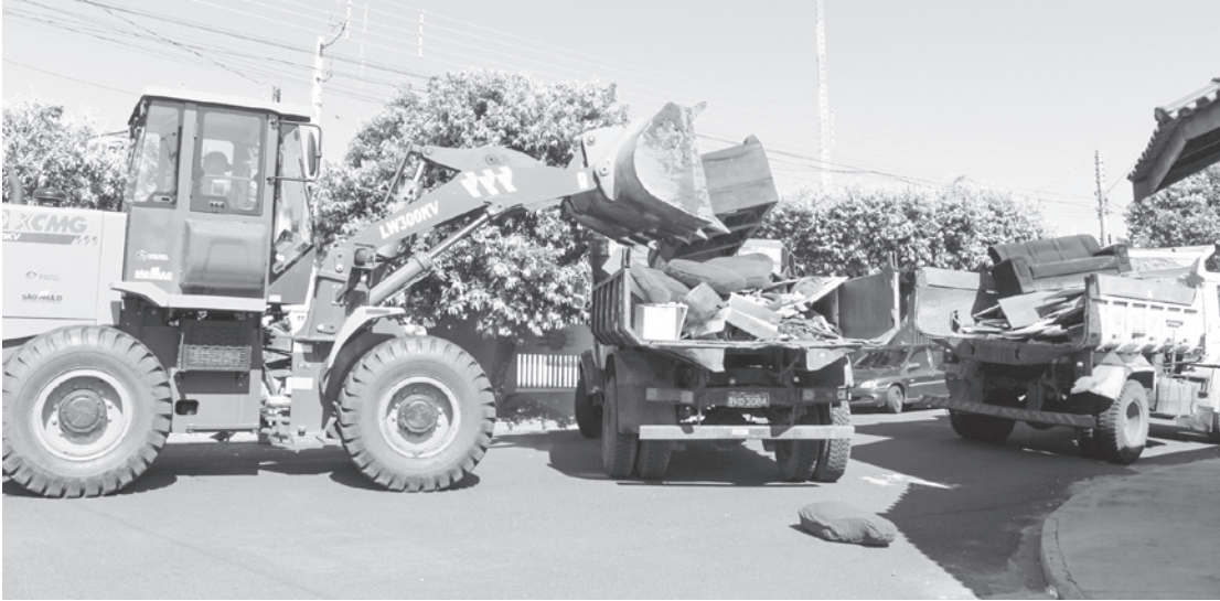
A 2ª edição do projeto Jales Mais Limpa passou por todos os bairros da cidade e recolheu quase 450 toneladas de entulhos e resíduos volumosos