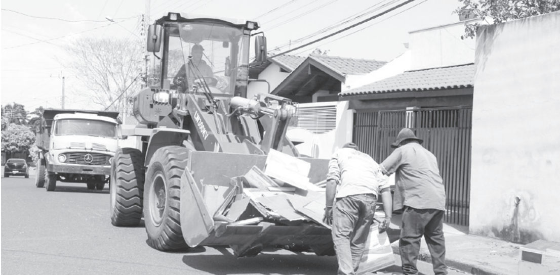
Em comparação com a primeira edição do projeto, realizada em fevereiro, quando foram recolhidas 220 toneladas de resíduos, a quantidade mais que dobrou na segunda edição, que recolheu 442,28 toneladas

Quase 450 toneladas de entulho e resíduos volumosos foram recolhidos pela Prefeitura de Jales, durante a 2ª edição do Projeto Jales Mais Limpa, que passou por todos os bairros da cidade entre os dias 24 de outubro e 16 de novembro. O projeto é uma realização da Secretaria de Agricultura, Pecuária, Abastecimento e Meio Ambiente, com apoio de parceiros e das Secretarias de Desenvolvimento Urbano, Infraestrutura e Mobilidade Urbana, de Saúde e de Comunicação Social. Em fevereiro, durante a primeira edição do Jales Mais Limpa, foram retirados pela população dos quintais e interior de suas residências 220 toneladas de resíduos. Agora, na segunda edição, foram exatas 442,28 toneladas, ou seja, a quantidade mais que dobrou, mostrando que o projeto foi aprovado pela comunidade jalesense.