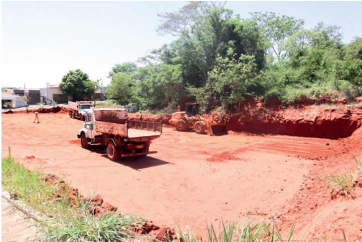
A construção da base para colocação da estrutura esportiva já foi iniciada pela Prefeitura Municipal