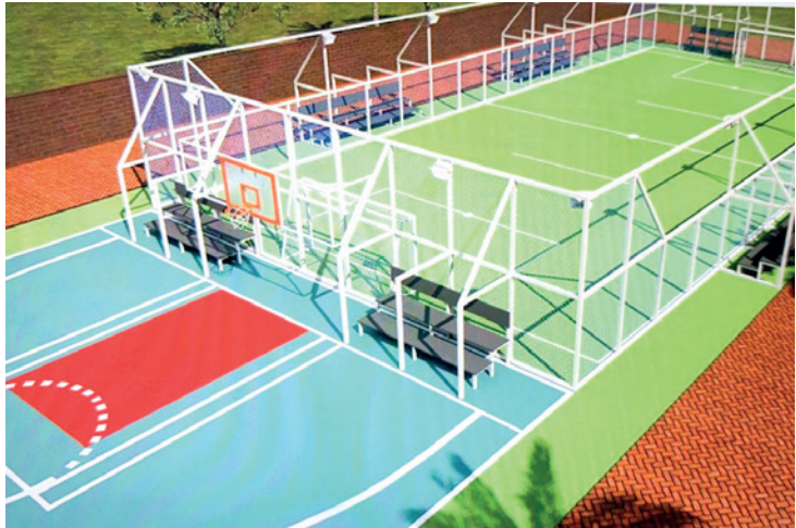
Projeto Areninha será composto por um campo de futebol society e uma quadra de basquete 3×3, equipados com iluminação de LED e arquibancada