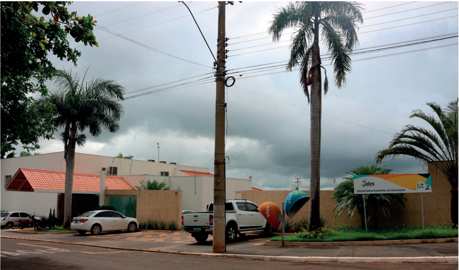
A entrega dos documentos e da ficha de inscrição impressa e preenchida deve ser entregue até o dia 3 de fevereiro na sede da Secretaria de Educação, localizada na Avenida José Rodrigues, nº 120, no Jardim do Bosque

“Essa cesta básica deve conter itens como 5kg de arroz; 5kg de açúcar; 2kg de feijão; 1 kg de sal; 1 kg de farinha de