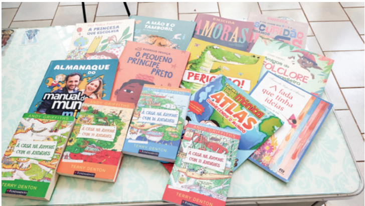
Outlander, um dos livros mais pedidos pelos leitores, faz parte das novas aquisições

to da ficha cadastral". O horário de funcionamento da Biblioteca Municipal é de segunda a sexta-feira, das 7h30 às 11h30 e da 13h às 17h, localizada na Rua Oito, nº 2260, no centro.