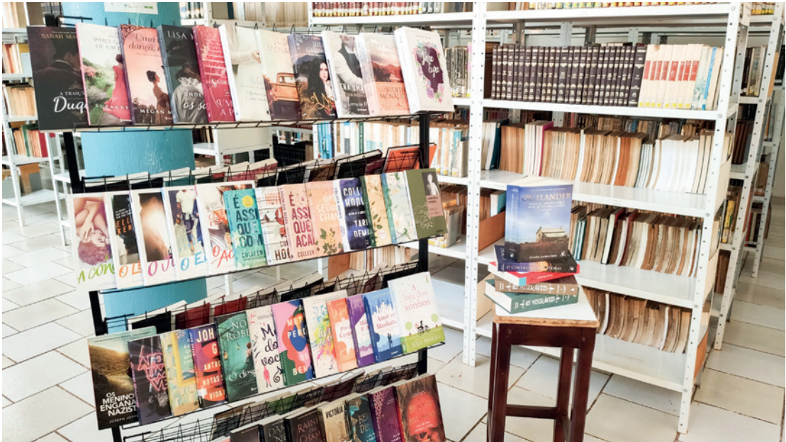
Grandes títulos foram escolhidos para agradar os frequentadores da Biblioteca Municipal de Jales