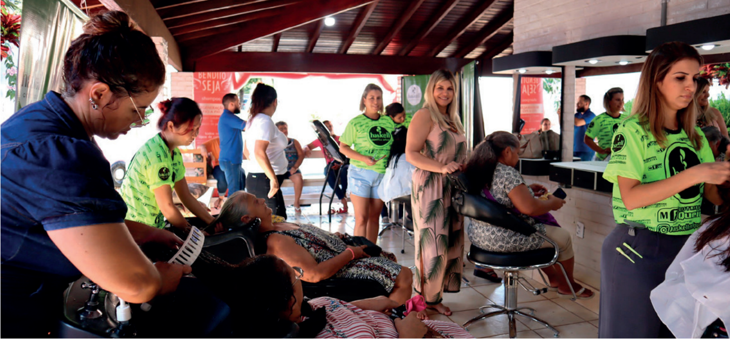
Serão oferecidos serviços gratuitos de hidratação, corte de cabelo e sobrancelha no salão de beleza do Fundo Social de Solidariedade

“Faço um convite às mulheres, principalmente em situação de vulnerabilidade, que procure o Fundo Social de Solidariedade na Avenida Jânio Quadros n. 305, e façam a sua inscrição para receberem cuidados especiais de beleza. Um presente do Fundo Social de Solidariedade para aumentar a autoestima das mulheres carentes da nossa cidade”.