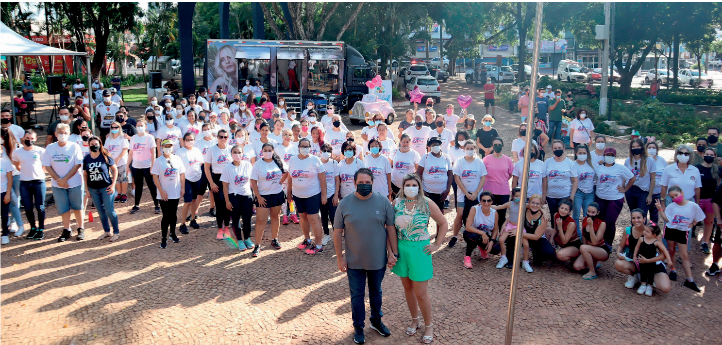
No ano passado, houve grande adesão à caminhada e as participantes lotaram a Praça João Mariano de Freitas

a data, promover o estímulo da prática de atividades físicas e conscientizar a população sobre a violência contra a mulher, o evento está sendo preparado com muito carinho e as participantes serão recepcionadas com café da manhã. É importante ressaltar que, assim como no