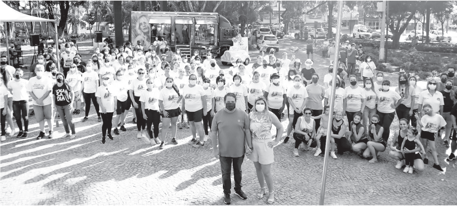
No ano passado, houve grande adesão à caminhada e as participantes lotaram a Praça João Mariano de Freitas

A ação é uma iniciativa da Secretaria Municipal de Esportes e Juventude em parceria com as Secretarias Municipais de Saúde, Comunicação, Desenvolvimento Social, Inspeção Regional de Esporte e Lazer de Jales (IREL), Polícia Militar, Delegacia da Mulher, Fundo Social de Solida-