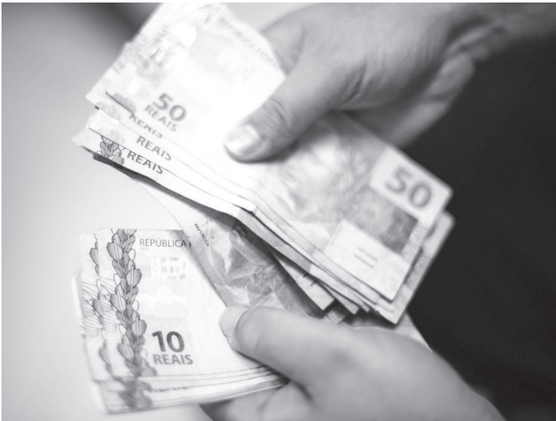
Serão oferecidos serviços gratuitos de hidratação, corte de cabelo e sobrancelha no salão de beleza do Fundo Social de Solidariedade

dos em seis lotes, sendo que o pagamento do PIS é baseado no mês de nascimento. No caso do Pasep, é considerado o número final de inscrição no programa. O dinheiro será depositado nas datas de liberação dos lotes e todos os beneficiários podem sacar o dinheiro até o dia 28 de dezembro de 2023. Nesta quarta-feira, podem sacar os trabalhadores nascidos em janeiro e fevereiro ou com final da inscrição 0. Veja o calendário abaixo. Valores do pagamento O valor do abono salarial é pago de acordo com a quantidade de meses trabalhados, e só recebe o valor máximo quem trabalhou os 12 meses do ano anterior. Veja abaixo os valores: Valores do abono salarial PIS- Pasep 2023 Mês Valor em R$ 1 108,5 2 217