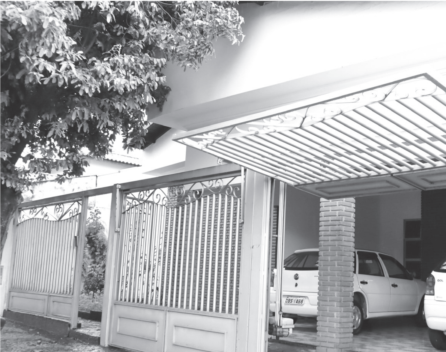
Secretaria de Desenvolvimento Social - O Fundo Municipal do Idoso está localizado na Secretaria Municipal de Desenvolvimento Social, na Rua 17, nº 2161 – Centro

O Fundo Municipal do Idoso está localizado na Secretaria Municipal de Desenvolvimento Social, na Rua 17, nº 2161 – Centro. Mais informações podem ser obtidas através do telefone (17) 3632-7719.