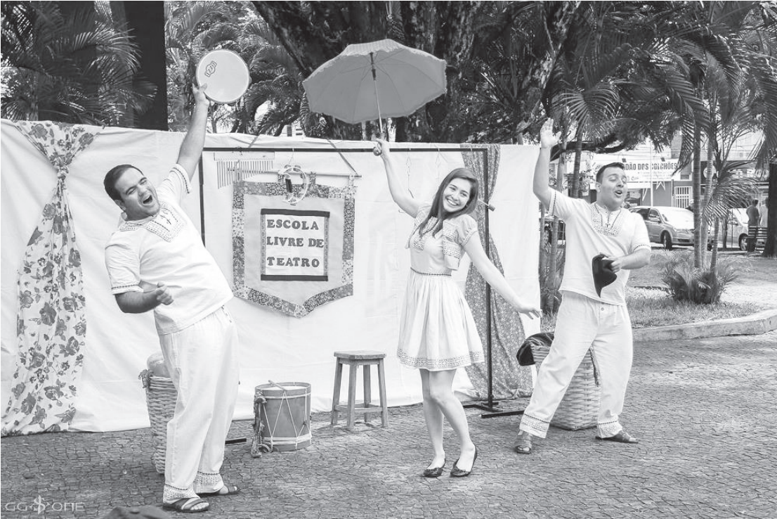
O “Festival Auto da Camisinha” vai percorrer diferentes bairros de Jales e Dolcinópolis em 9 apresentações para comemorar os 15 anos do espetáculo

Roda de conversa com elenco que integrou o espetáculo Auto da Camisinha em seus 15 anos. Horário: 14h Local: Teatro Municipal de Jales Endereço: Rua 08, nº 2270, Centro, Jales-SP • 19/03 (Domingo) Apresentação de Abertura / Sarau no Ponto Horário: 16h Local: Área externa do Ponto de Cultura Escola Livre de Teatro Endereço: Rua 07, S/N, Centro, Jales-SP • 25/03 (Sábado)