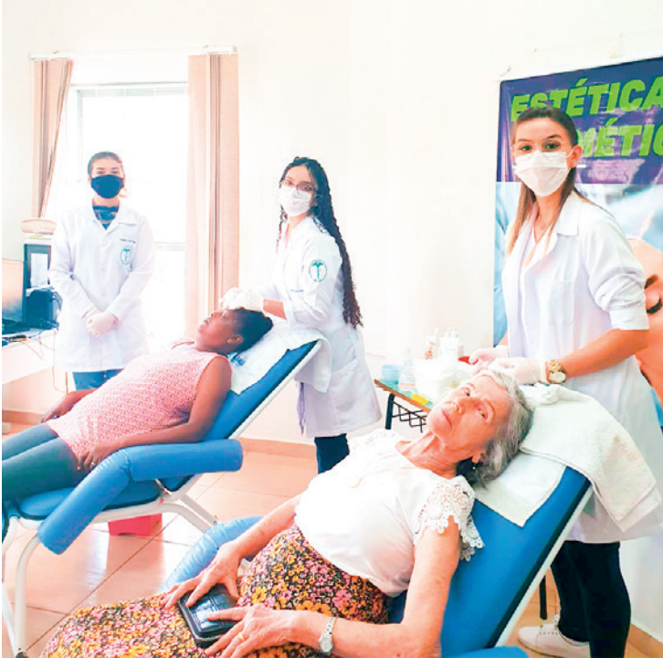
Discentes de Estética e Cosmética realizando procedimentos por meio do Projeto Integrador e Disciplinar