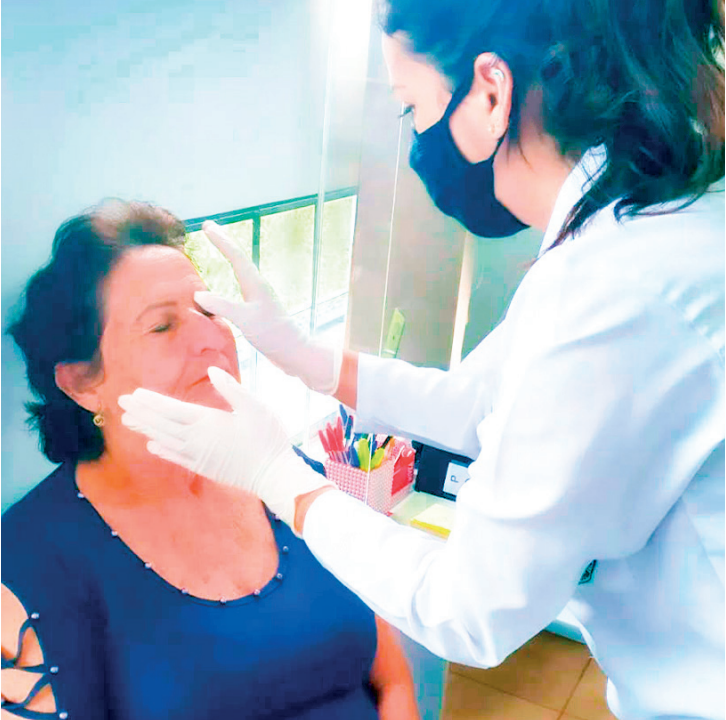
Atividades foram realizadas no CRAS de Aspásia