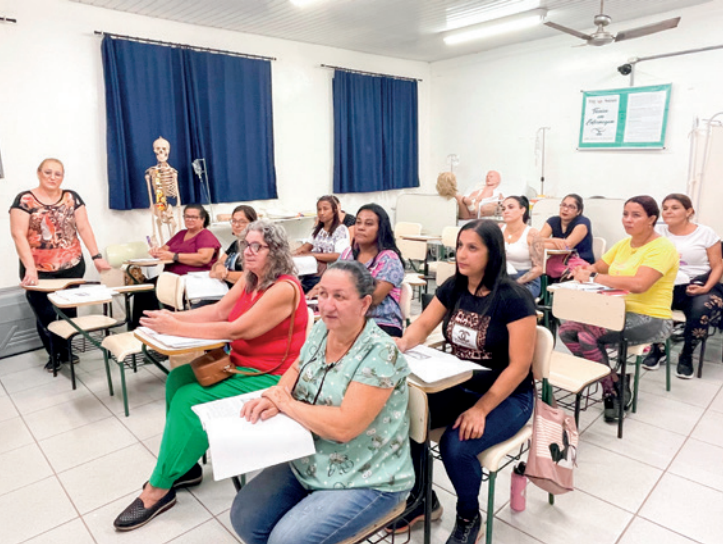
Alunos do curso de Cuidador de Idosos que está sendo ministrado na unidade central da ETEC Jales