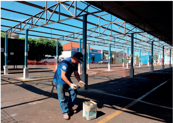
A obra será executada em duas partes, para que os feirantes possam utilizar metade do espaço durante a reforma