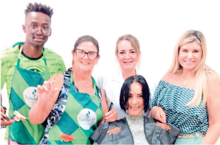
Colaboradoras do Ambulatório Médico de Especialidades - AME de Jales com a equipe do Fundo Social de Solidariedade e voluntários no Dia da Beleza em comemoração ao Dia Internacional da Mulher

O Fundo Social de Solidariedade finalizou o mês internacional da mulher com uma ação inédita na OAB e no Ambulatório Médico de Especialidades - AME de Jales: proporcionando atendimentos gratuitos de beleza às colaboradoras das instituições.