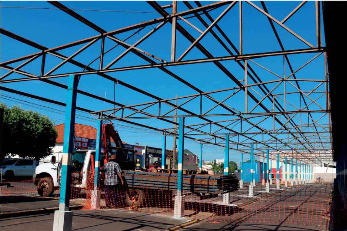
Para melhor atender os feirantes e a população, o Comboio está passando por reforma e adequação

A reforma foi viabilizada por um convênio firmado junto ao Governo Estadual, disponibilizado, à época, por meio da Secretaria do Desenvolvimento Regional, atualmente Secretaria de Governo e Relações Institucionais..