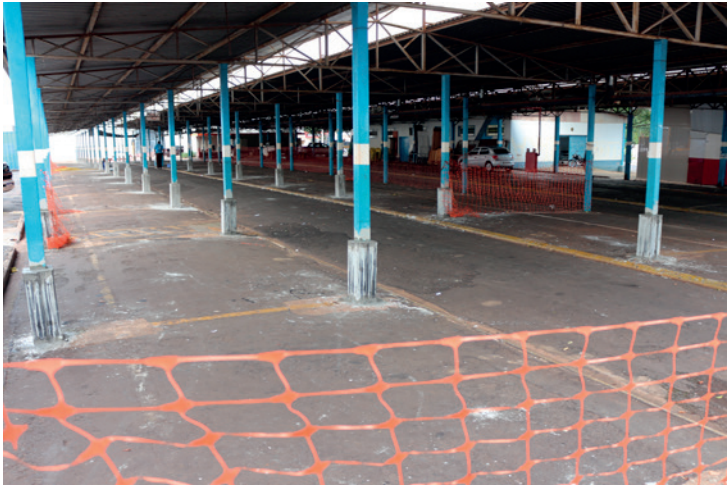
O Comboio receberá melhorias em todos os setores

Prefeitura irá executar a obra em duas partes, para que durante a reforma os feirantes possam utilizar a metade do espaço para realizar a feira às quartas e aos sábados. Após a conclusão dessa etapa, os feirantes vão utilizar o espaço reformado para que a outra metade passe por obras de reforma.