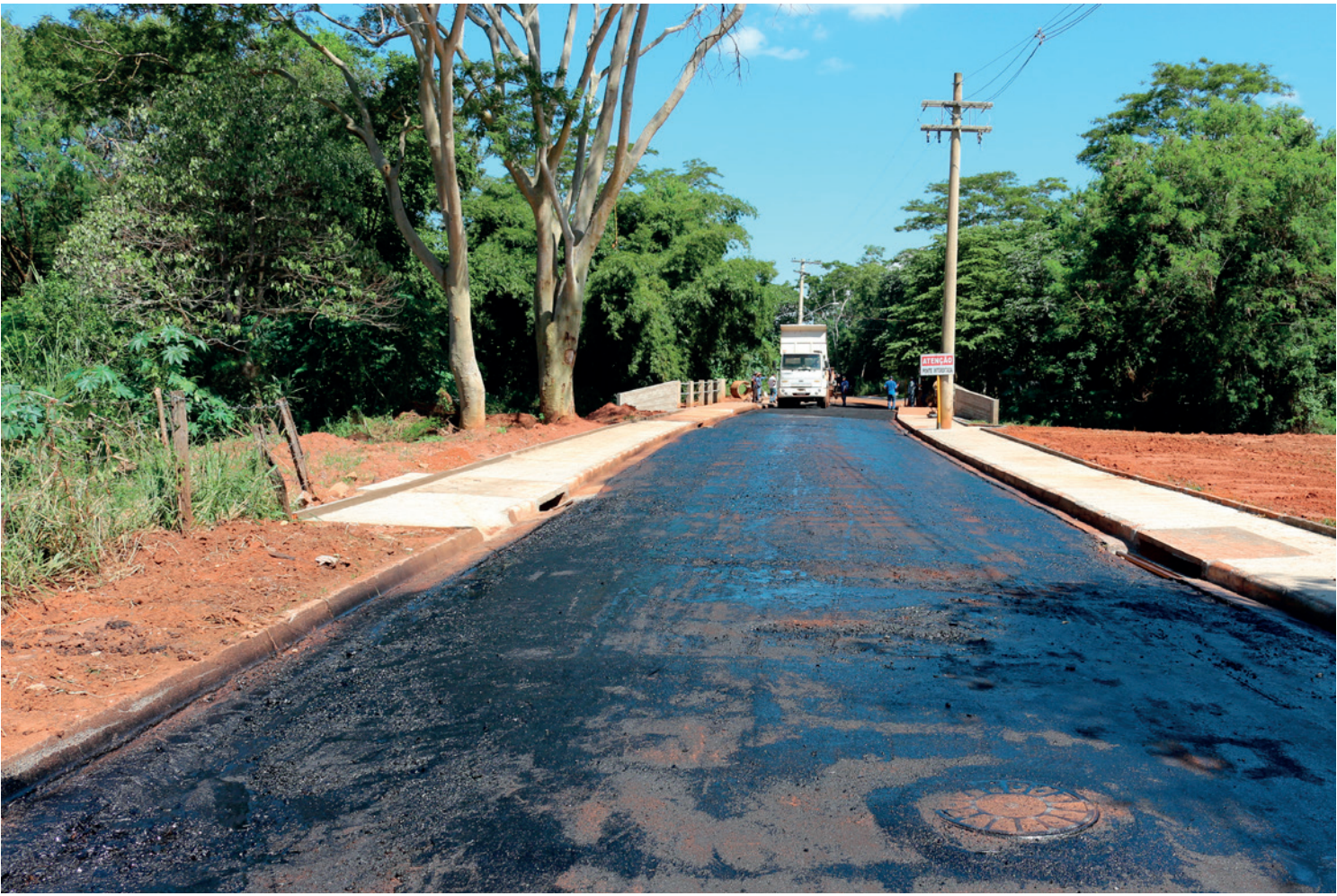
A Prefeitura vai inaugurar algumas obras e projetos no mês de abril, como por exemplo, a Ponte da Rua 19

Entre os dias 23 e 30 de abril acontece o Torneio Regional de Handebol “Trophéu Cidade de Jales”, a partir das 8 horas,