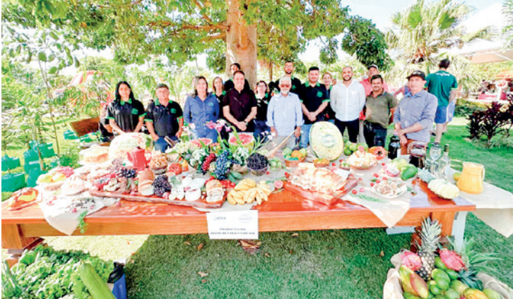
A equipe da Secretaria de Agricultura e Meio Ambiente ao lado da mesa que expôs os produtos da Agricultura Familiar comercializados no Comboio Municipal