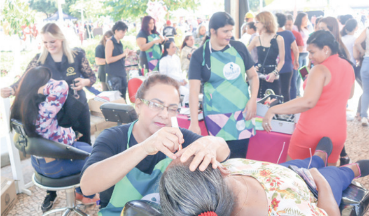
O Fundo Social de Solidariedade esteve presente com o Espaço da Beleza, oferecendo corte de cabelo, tranças, design de sobrancelha e maquiagem