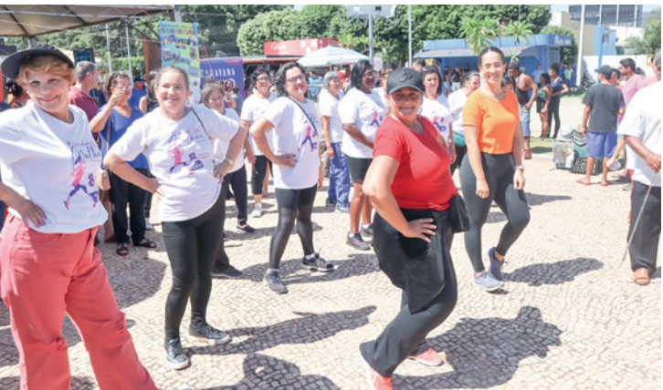
O grupo da terceira idade participou de um aquecimento na Praça Dr. Euphly Jalles