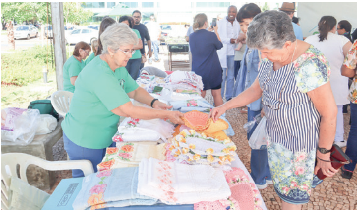
Alunas de cursos ministrados pelo Fundo Social de Solidariedade realizaram exposição de artesanato