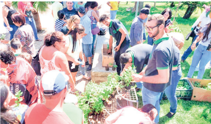
A Secretaria de Agricultura e Meio Ambiente realizou a distribuição de mudas de plantas