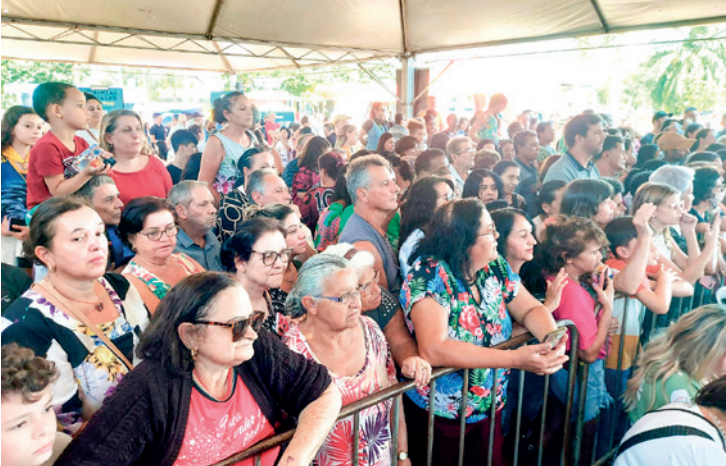
Cerca de 3.500 pessoas prestigiaram a Caravana 20 Anos da TV Tem

O evento reuniu ainda muita cultura e arte, com dança de Catira, apresentação do grupo Benfeitores da Alegria, com participação do