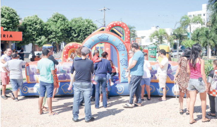
Brinquedos infláveis fizeram a alegria da criançada na Praça Dr. Euphly Jalles

ram e se divertiram nos brinquedos. A parte gastronômica também encantou com produtos comercializados no Comboio e também produzidos no comércio e pela comunidade foram servidos aos repórteres. A Cafeteria Fiorani também levou para o espaço um estande onde serviu uma edição especial de café, elaborado em sachês personalizados individuais. A praça também recebeu a kombi personalizada da Lems Chopp Artesanal que serviu chopp gelado. Pipoca e refrigerante também foram distribuídos para as crianças.