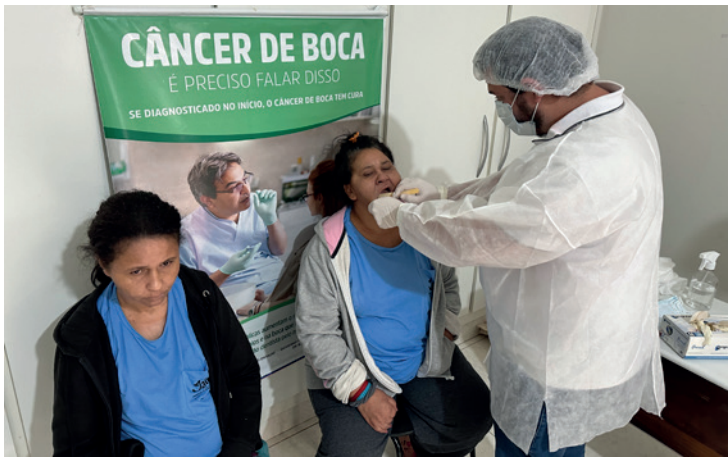
Dentistas da rede municipal de saúde estão realizando Campanha de Rastreamento de Câncer Bucal em diversos pontos da cidade