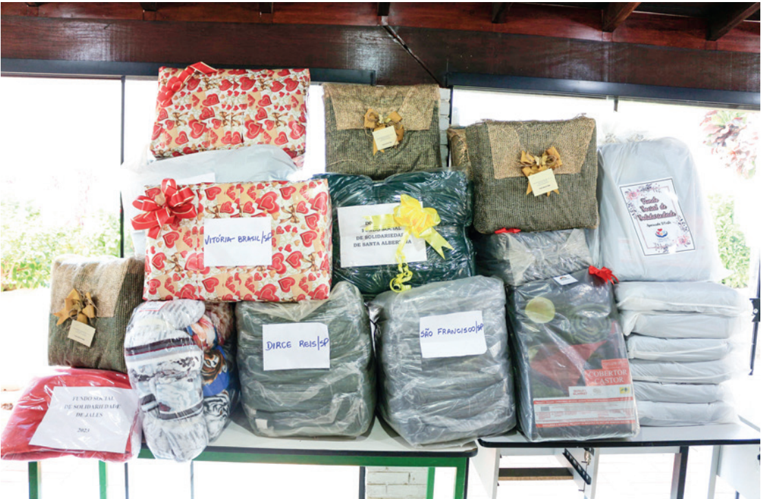
Na ocasião o Fundo Social recebeu a doação de 130 cobertores e mantas, que serão encaminhados à UPA