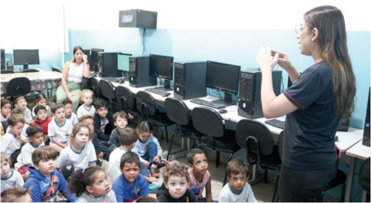
Os alunos das escolas municipais tiveram a oportunidade de esclarecer diversas dúvidas

ros como animais de estimação em casa, devem ser tomados cuidados como o uso de coleira repelente,