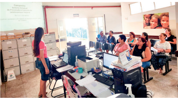
Enquanto aguardavam, pacientes receberam orientações sobre prevenção à Leishmaniose nas salas de espera das unidades de saúde