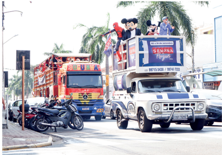
Diversão garantida: o trenzinho da alegria vai estar na cidade durante todos os dias do evento com passeio de graça para a população