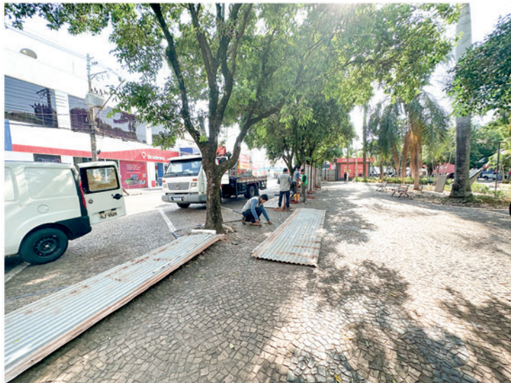
A Prefeitura de Jales iniciou essa semana as obras de reforma e adequações na Praça João Mariano de Freitas

noel Andreo de Aro, a reforma e adequações da praça vão prever projeto de iluminação de todo o espaço (com 77 postes, 288 luminárias LED, 37 refletores LED, 98 luminárias tipo balizador com tela de proteção); execução de novos sanitários, com acessibilidade; adequações no coreto com nova cobertura, piso, corrimãos e guarda-corpos, instalações elétricas e pintura; execução de calçamento e instalação de seis bancos curvos com floreiras no trecho da praça voltado para a Avenida Francisco Jalles; recapeamento asfáltico dos estacionamentos voltados para as Ruas 9 e 6; adequação no acesso ao ponto de ônibus e praça (construção de rampas e escada); adequações na entrada do estacionamento infantil, visando acessibilidade e complemento do colchão de areia; execução de espaço para futura implantação de um segundo parque infantil (calçamento, bancos, gradil