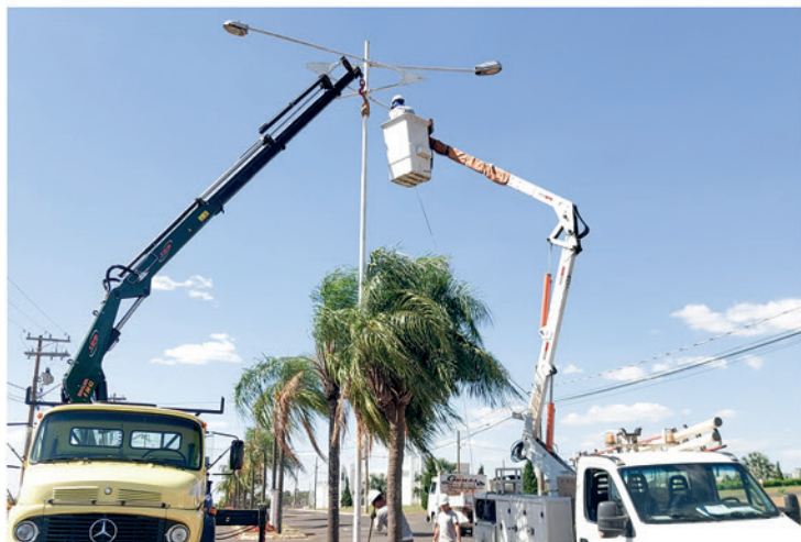
Todo o sistema de iluminação convencional foi substituído por LED no prolongamento da Avenida João Amadeu durante o mês de agosto

que, o objetivo é estender o projeto de iluminação de LED para toda a cidade. “Estamos trabalhando