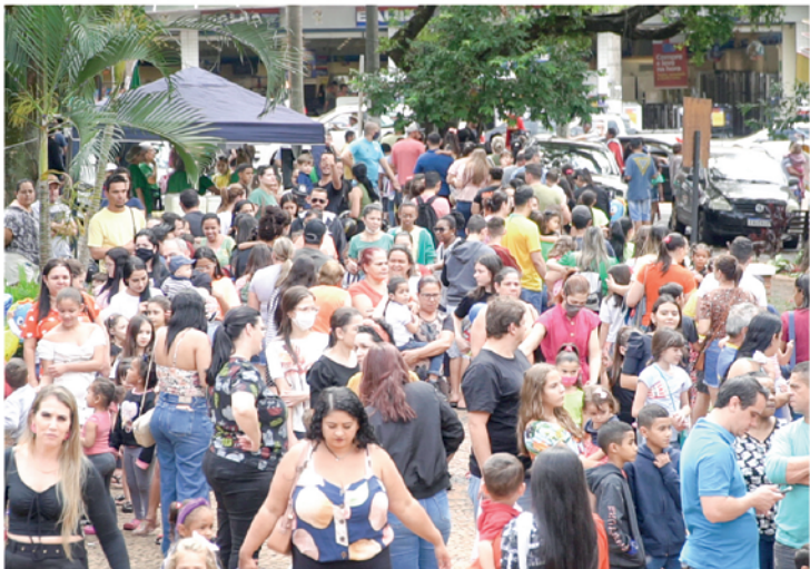
Moradores de Jales e da região irão encontrar descontos incríveis no comércio jalesense entre os dias 08 e 14 de setembro

AACIJ e a Prefeitura de Jales estão, pelo terceiro ano consecutivo, organizando um grande evento para movimentar a economia do comércio. É a tradicional Semana do Freguês, repleta de descontos incríveis no comércio de Jales, que acontecerá entre os dias 08 e 14 de setembro. A proposta é de que durante os seis dias da campanha, quem passar pelo comércio jalesense encontre ofertas em todos os segmentos.