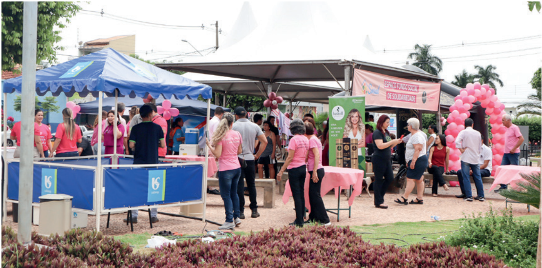
Diversos setores da saúde do município e o Fundo Social de Solidariedade estarão presentes no evento ofertando serviços para a população