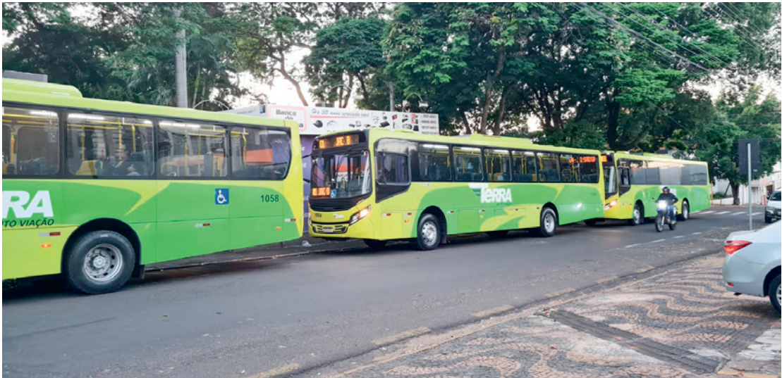
O transporte público municipal poderá ser avaliado por seus usuários por meio de uma pesquisa de satisfação disponibilizada no site da Prefeitura de Jales

coletivo diariamente é fundamental para podermos identificar áreas que podem ser aprimoradas e, com isso, tornar o transporte público de Jales mais eficiente e satisfatório para todos. A partir dessas informações, vamos conseguir tomar medidas mais assertivas com o objetivo de melhorar cada vez mais o transporte público”. No mês de junho de 2023 a Prefei-