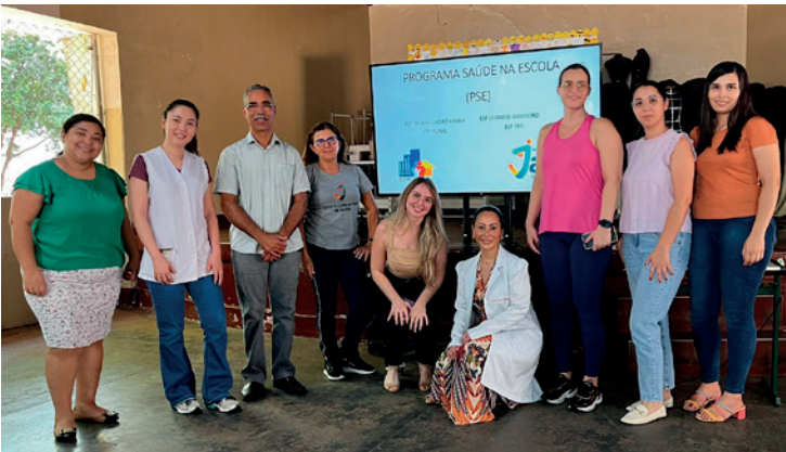
Os profissionais das ESFs Rural e Oiti também promoveram o Programa Saúde na Escola na ETEC – unidade central

Na manhã da última quinta-feira, dia 28 de setembro, equipes das ESF Estratégia de Saúde da Família Dr. José Cícero Fontes Xavier (Rural) e Leonisio Gambero (Oiti) estiveram na Escola Técnica Dr. José Luiz Viana Coutinho – ETEC (Escola Agrícola) para realizar mais uma etapa do PSE – Programa Saúde na Escola, desenvolvido pelos Ministérios da Saúde e da Educação com o objetivo de promover a qualidade de vida dos alunos, abordando questões relacionadas à saúde dos estudantes. Na semana passada, o programa foi realizado na unidade ETEC, na Rua 13, no Centro.