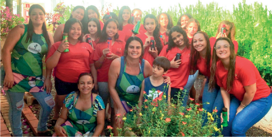
Crianças e Adolescentes do Projeto Corpo e Mente em Movimento/Sacra ganharam atendimento especial no salão de beleza do Fundo Social de Solidariedade

As meninas ganharam hidratação nos cabelos realizada por profissionais que participaram dos cursos de capacitação do Fundo Social de Solidariedade, a ação também teve apoio da empresa Haskell e Drograria Ultrapopular. Além dos cuidados com os