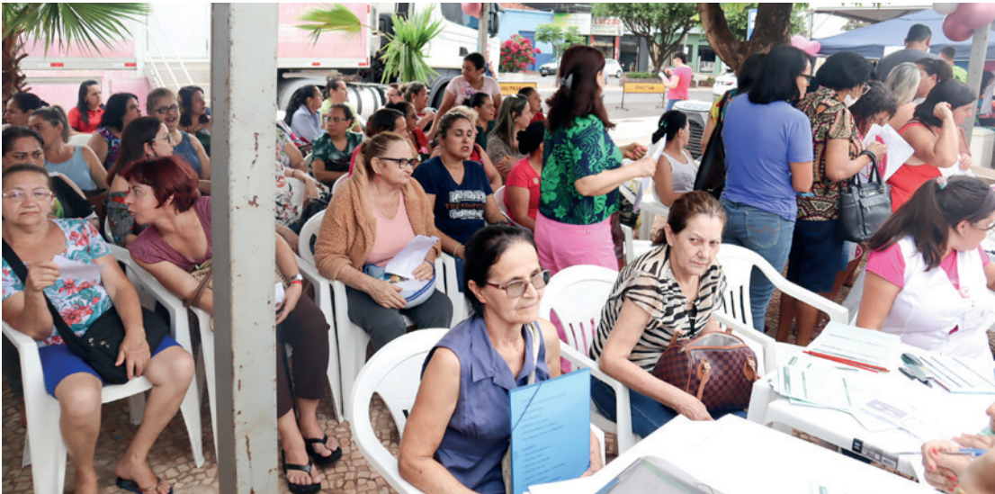
O Hospital de Amor, a AVCC e a Prefeitura de Jales irão levar a Carreta da Mamografia e diversos serviços para a Praça Euphly Jalles no dia 09 de outubro

No mês de prevenção e diagnóstico precoce do câncer de mama, o Hospital de Amor, a Associação de Voluntários de Combate ao Câncer (AVCC) – Região de Jales e a Prefeitura de Jales, por meio da Secretaria Municipal de Saúde, irão realizar no dia 9 de outubro, na Praça Dr. Euphly Jales, uma série de atividades de saúde e entretenimento, das 9h às 19h, com o objetivo de promover os cuidados com a saúde da mulher e a conscientização sobre a prevenção do câncer de mama.