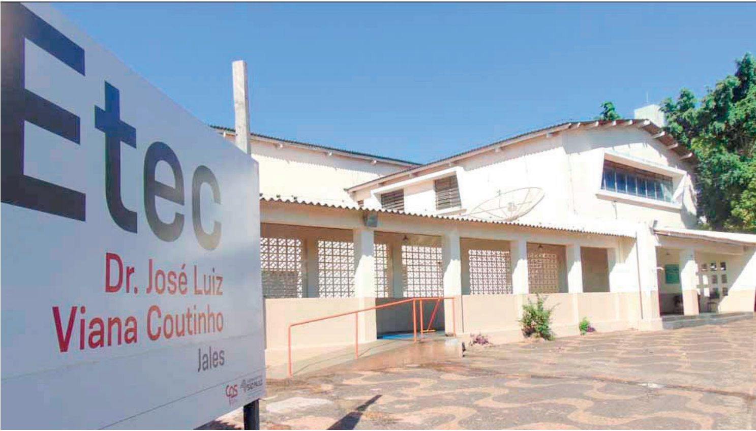
A Escola Técnica Estadual de Jales (Etec Jales) Dr. José Luiz Viana Coutinho está com as inscrições abertas para quem deseja ingressar na instituição no 1º semestre de 2024

As opções de cursos para os estudantes que querem ingressar no Ensino Médio Técnico ou na Articulação Ensino Médio com o Superior são: em turno parcial, no período da manhã: Ensino Médio Técnico em Adminis-