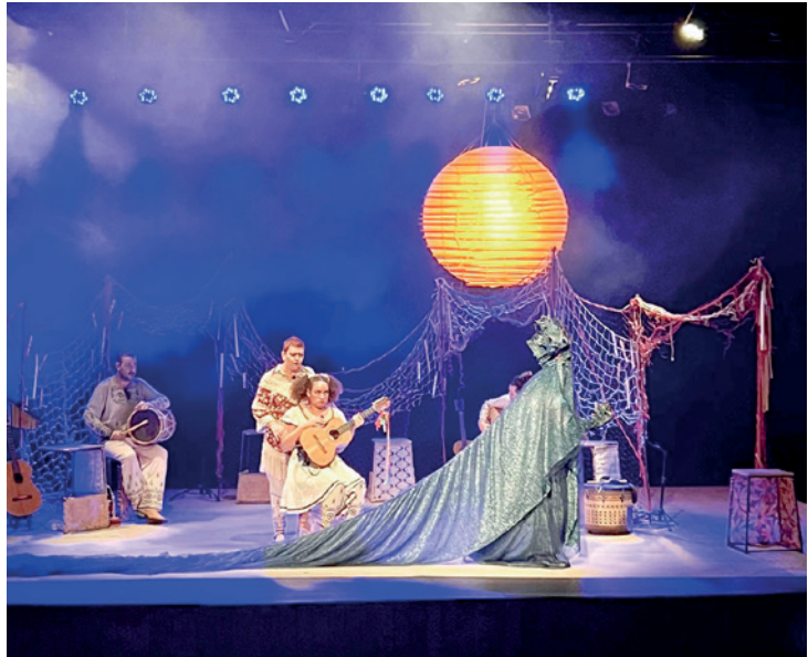
Diversos espetáculos fizeram com que o Teatro Municipal, a Casa do Poeta e Escritor, a Areninha do Jardim do Bosque e o Comboio ficassem lotados durante os dias de Festival Nacional de Teatro de Jales

O 9º Festival Nacional de Teatro de Jales, que aconteceu entre os dias 14 e 20 de novembro encerrou sua programação na última segunda-feira e foi um verdadeiro sucesso.