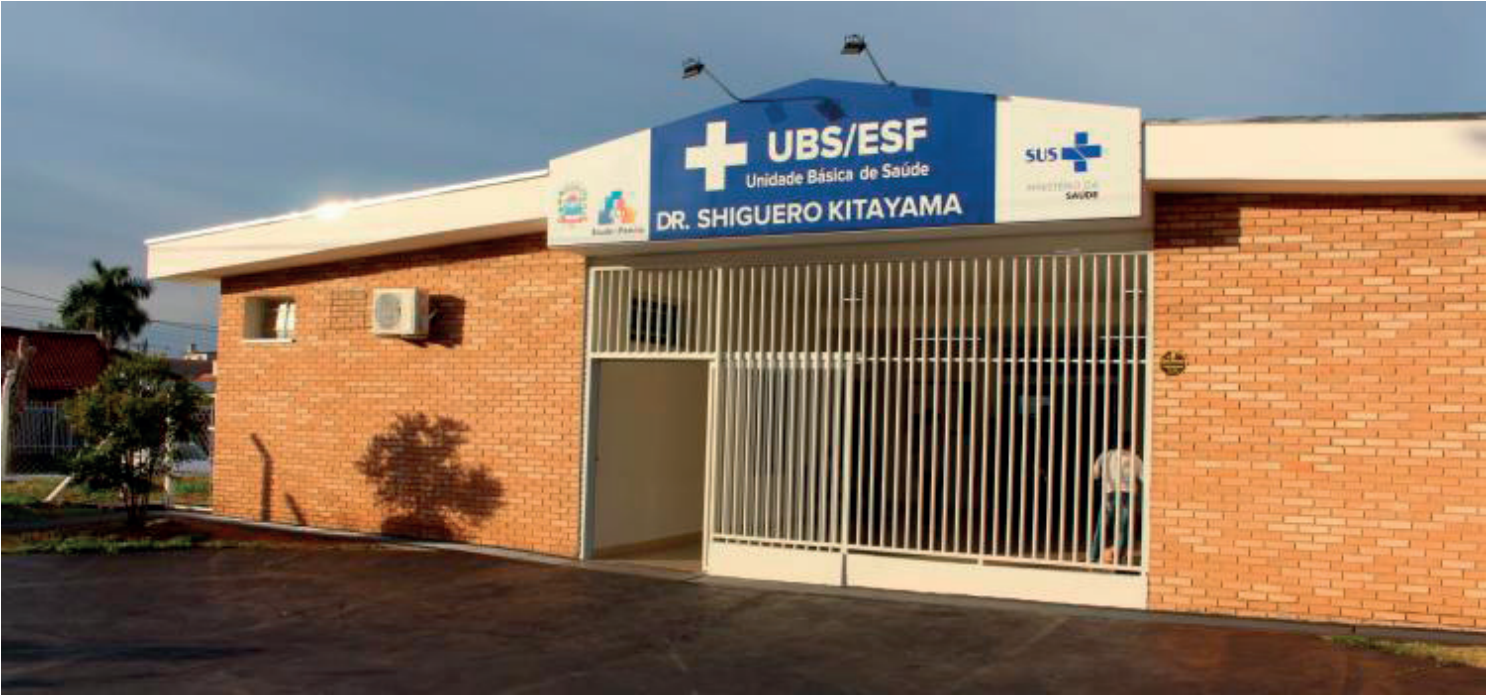
Durante todo o mês de novembro, as unidades de saúde de Jales estarão recebendo os homens e reforçando a importância dos cuidados, não só para a prevenção do câncer de próstata, mas de doenças em geral, incentivando essa população a assumir a responsabilidade e o protagonismo de cuidar da própria saúde

Também estamos realizando exames de PSA (Antígeno