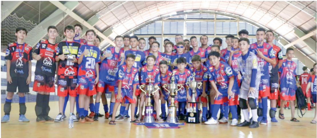
Os atletas da APAFUJ disputaram diversos campeonatos em 2023 e conquistaram importantes títulos no ano que passou