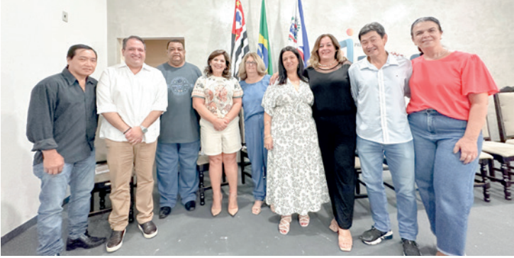
Os conselheiros tutelares titulares eleitos com as autoridades que participaram da cerimônia de posse