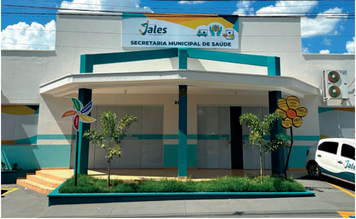
Placas em formato de flores e cata-ventos com canais de denúncia foram instaladas em locais públicos da cidade com o objetivo de sensibilizar a população de que a responsabilidade de proteger os direitos das crianças e adolescentes é de todos e a luta é diária