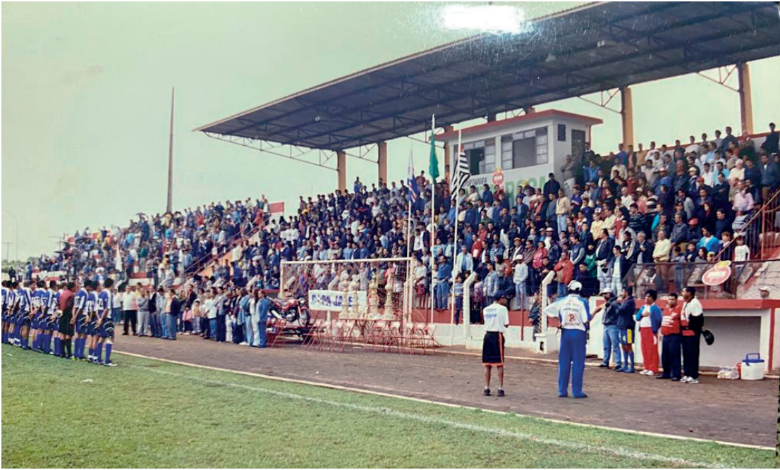
A última edição da Copa Jales em 2006 atraiu cerca de 2500 torcedores no estádio municipal