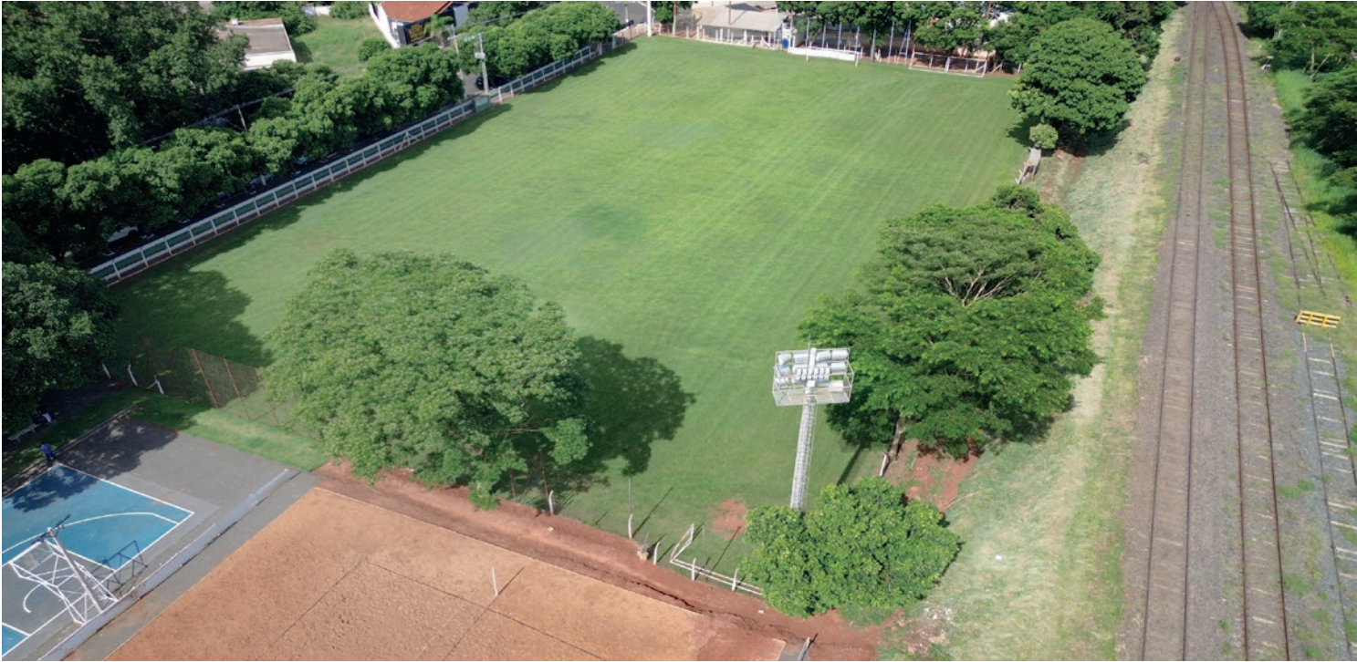
A Copa Jales 2024 promete movimentar o esporte amador de 10 de março a 1º de maio, no Campo da Fepasa