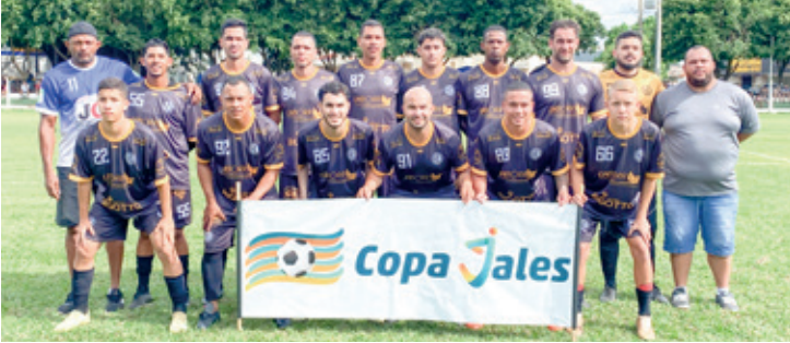
A equipe do Internacional Vila União, na foto, derrotou o time de Parisi, por 2 a 1