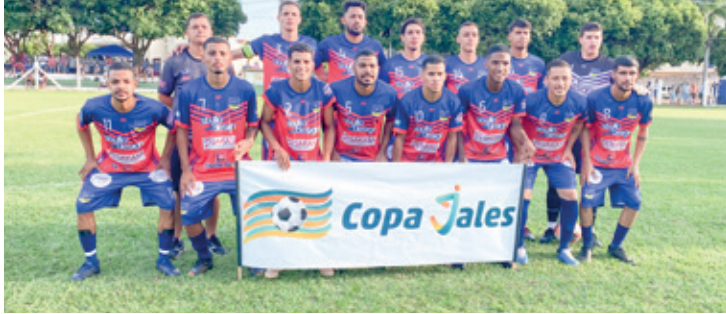
O Jalesense foi uma das equipes que disputaram a 2ª rodada da Copa Jales no último domingo