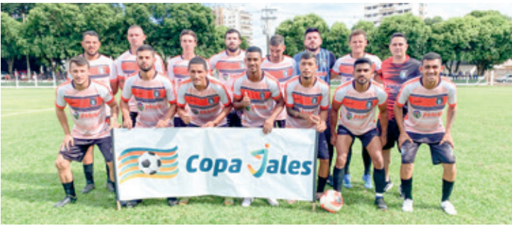
A equipe do Parisi

A competição continua e neste sábado (13), dois grandes jogos definem mais duas equipes que farão semifinal. Às 14:30 h o Resenha enfrenta o Paranaçu e em seguida, o Recreativo faz o dérbi Jalesense contra o 1º de Maio às 16h30.