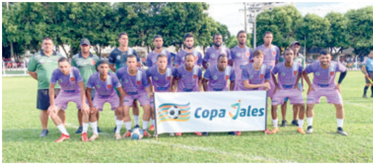
No segundo jogo do domingo o time Ouromix(foto) venceu o Jalesense por 4 a 1