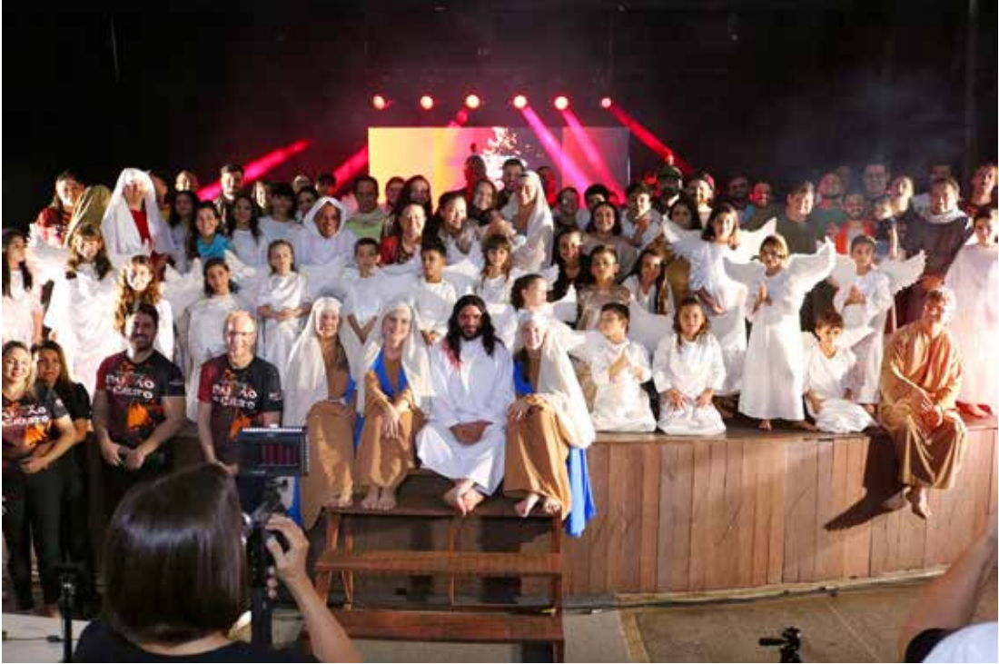
Com a apresentação do espetáculo Paixão de Cristo foram arrecadados 600 litros de leite, além de alimentos, que foram doados ao Fundo Social de Solidariedade