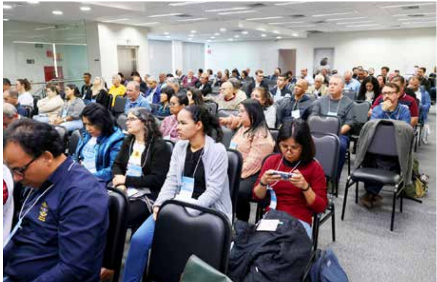
Cerca de 160 pessoas participaram do 2º Fórum Social