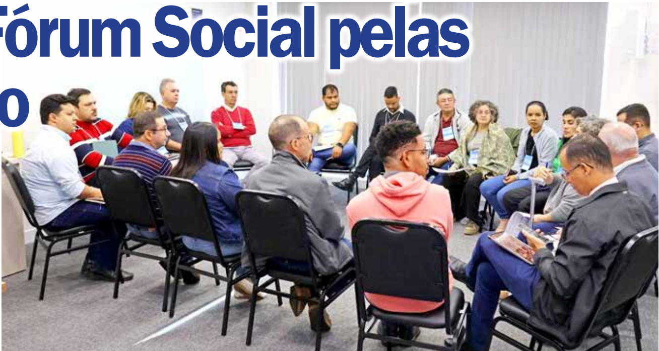
Durante o Fórum, os participantes foram divididos em grupos para discutirem sobre a Pastoral com os idosos, com as pessoas em situação de rua e sobre a implantação e fortalecimento da Ecologia Integral