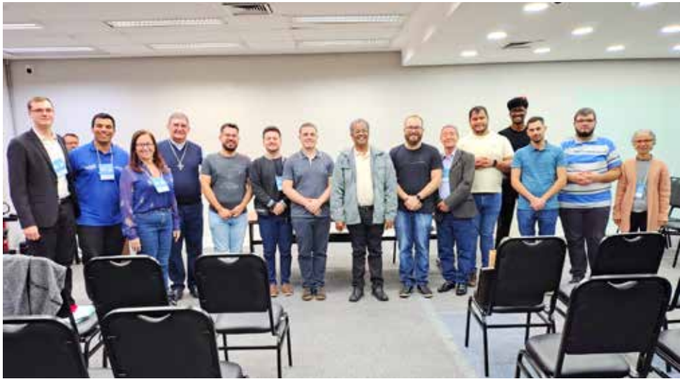
A Diocese de Jales esteve participando com 35 representantes, sendo eles do clero, seminaristas, religiosas, leigos e profissionais da comunicação